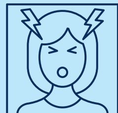
Dolor de cabeza

La mayoría de las personas se enferman levemente y pueden recuperarse en sus hogares. Si tiene una señal de advertencia de emergencia (como dificultad para respirar), obtenga atención médica de inmediato. Llame antes de ir al médico.