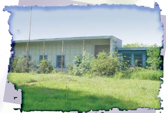
Ejemplo de un sitio de fabricación químico de Brownfield.

"propiedad inmobiliaria, la expansión, la recuperación o reutilización de los cuales puede ser complicado por la presencia o posible presencia de una sustancia peligrosa, contaminante o contaminantes".